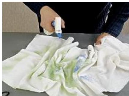
Нанесение средства КТ-1